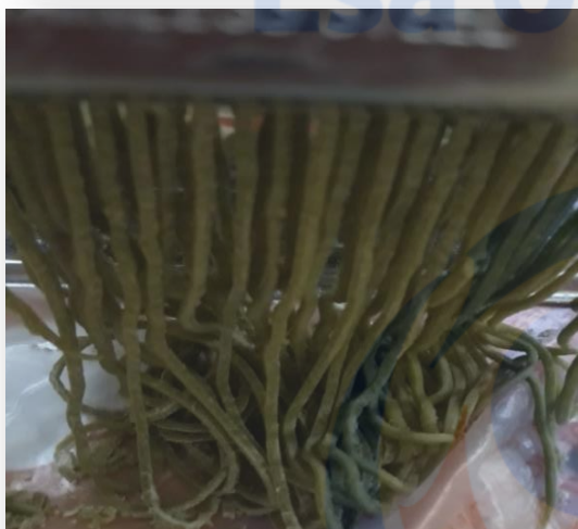
Proses penggilingan mie