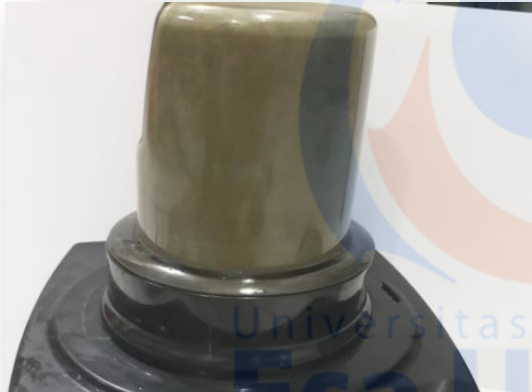
Daun torbangun pada saat diblender