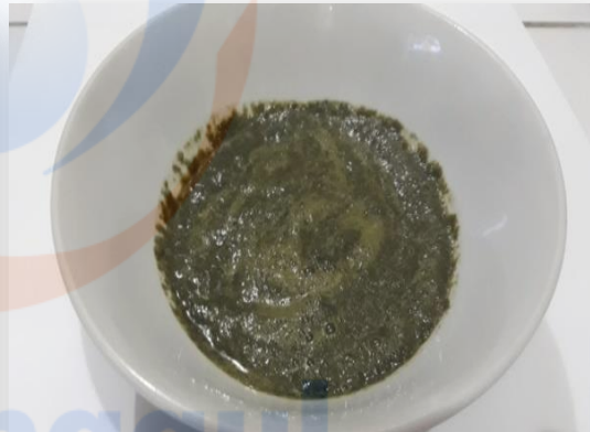
Daun torbangun setelah dibelnder