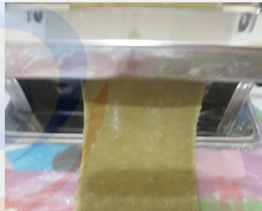
Proses pembuatan lembaran- lembaran mie